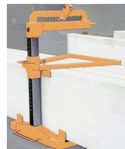
Horquilla para placas y paletas