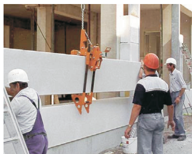
Sargenta FG/U con apoyos inferiores de seguridad para transporte por zonas elevadas