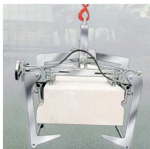
Tenazas para placas de techo con apoyos inferiores de seguridad para transporte por zonas elevadas